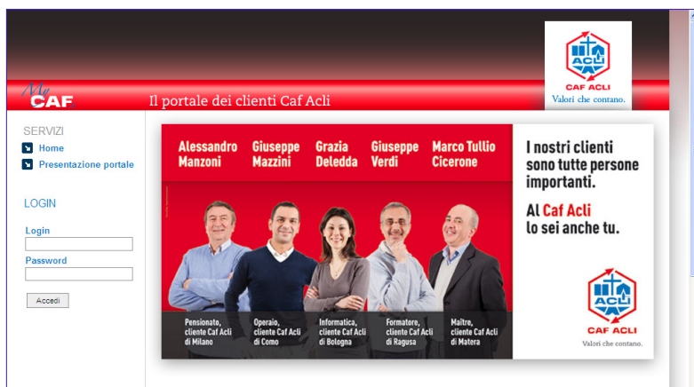
La home page del portale http://mycaf.it

E' online MyCaf, il portale con tutte le pratiche svolte presso i nostri uffici.