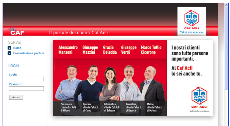
La home page del portale http://mycaf.it

E' online MyCaf, il portale con tutte le pratiche svolte presso i nostri uffici.