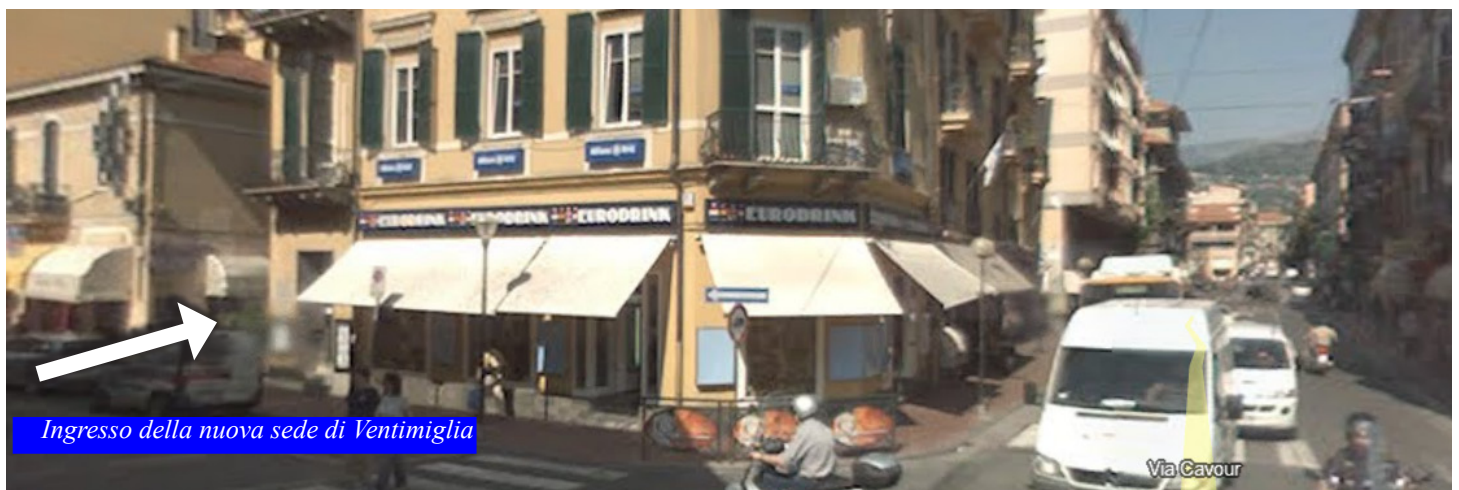
Ingresso della nuova sede di Ventimiglia